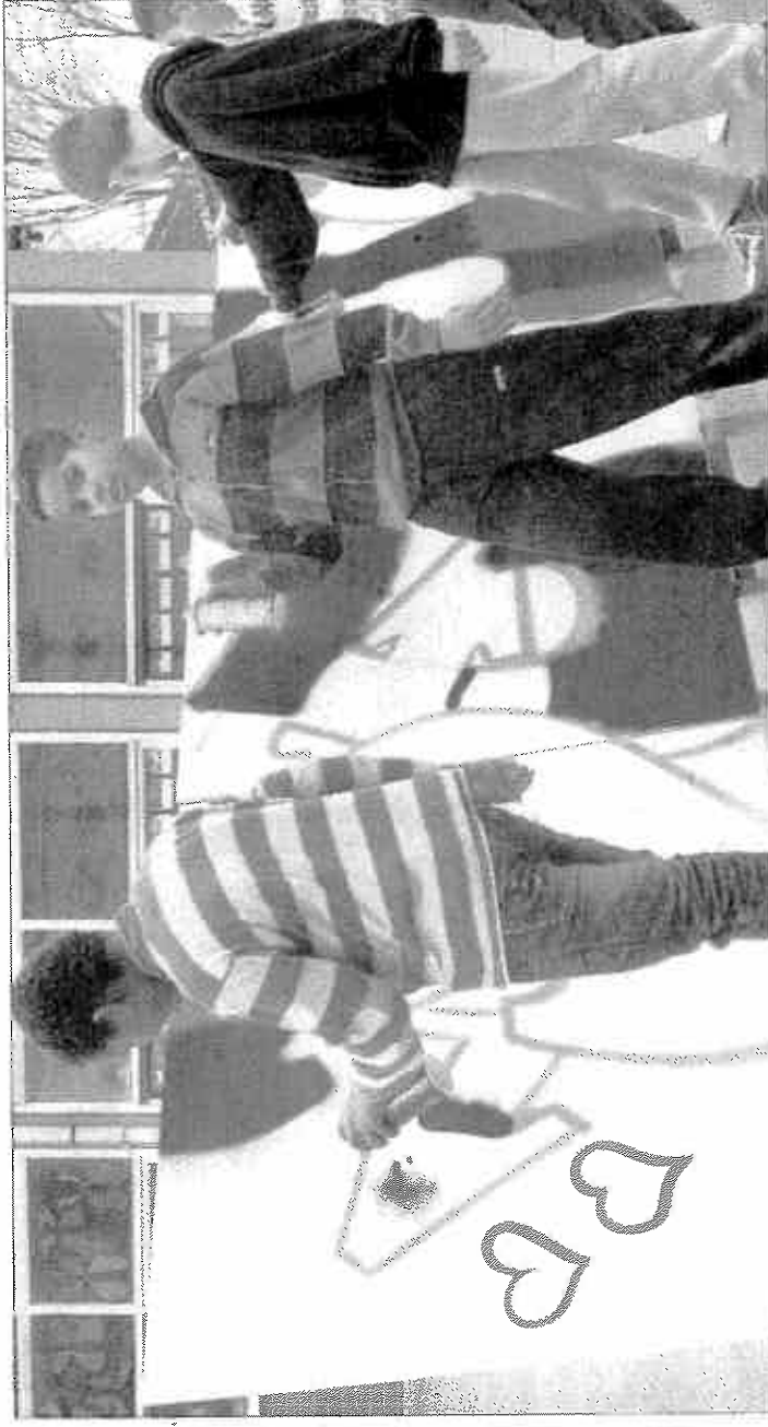
Kinderen van groep 7 van de Ariënschool tijdens de graffiti's.